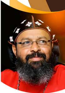
ഡോ. സതിയാസ് മാർ അപ്രേം