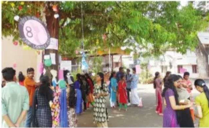
▶ വനിതാദിനാചരണത്തോടനുബന്ധിച്ച് പെൺമരമായി അലങ്കരിച്ച സമരമെത്തിന് മുന്നിൽ കോട്ടയം ബസേലിയസ് കോളേജിലെ വിദ്യാർത്ഥി-വിദ്യാർത്ഥിനികൾ