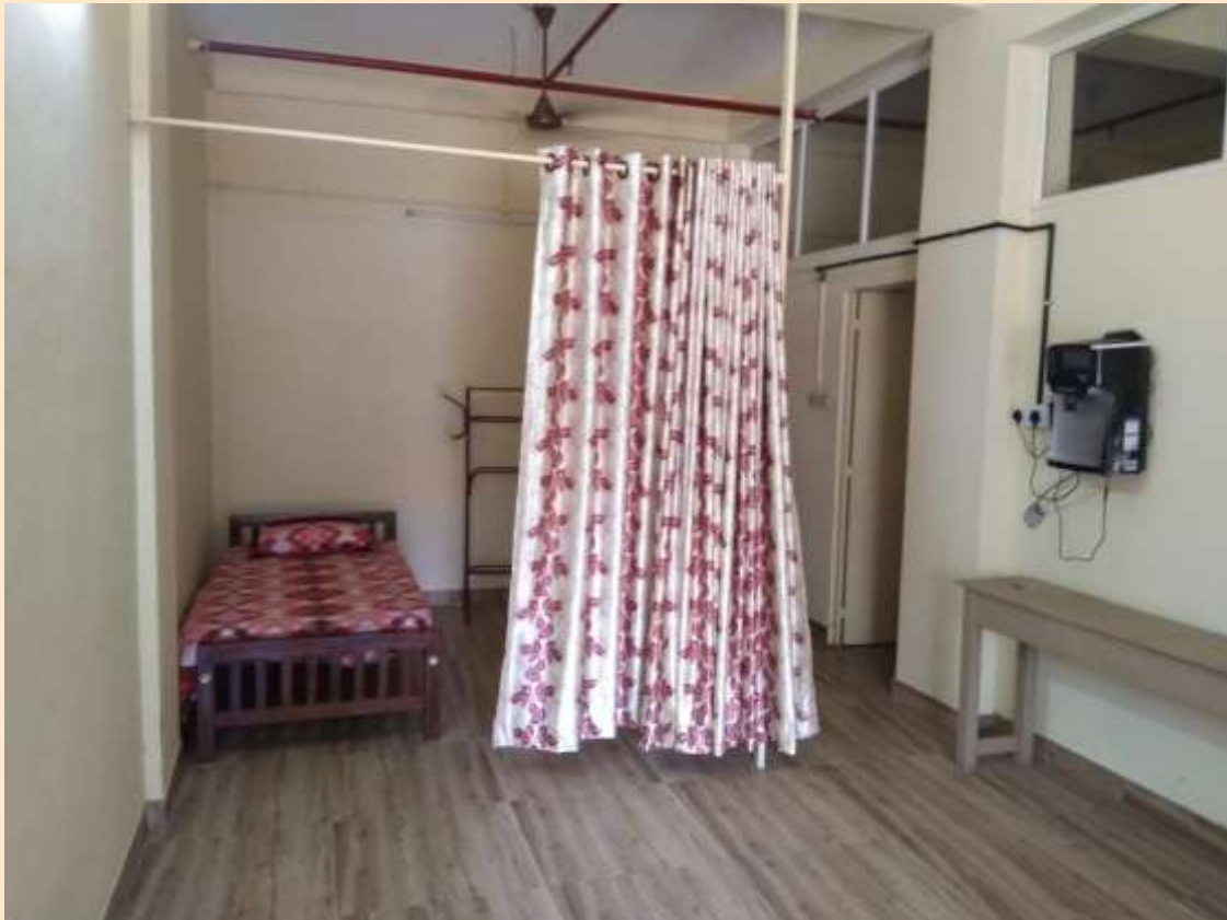
Napkin Vending Machine Inside the Women's Hall