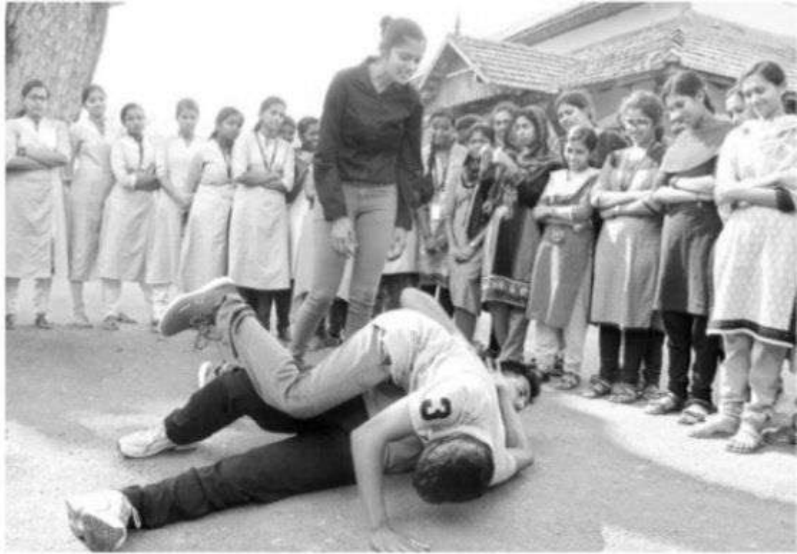
വനിതാദിനത്തോടനുബന്ധിച്ചു ബന്ധുലീയസ് കോളജ് എൻഎസ്എസ് യൂണിറ്റിന്റെ ആഭിമുഖ്യത്തിൽ സംഘടിപ്പിച്ച സെൽഫ് ഡിഫൻസ് പരിപാടിയിൽനിന്ന്.