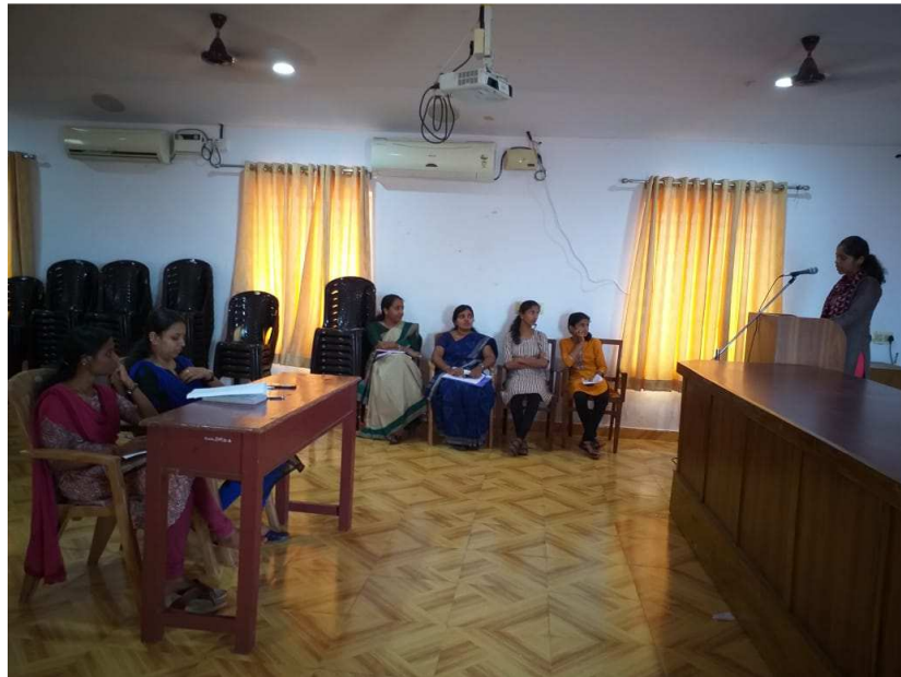
An appraisal on the impact of Union Budget 2019-2020